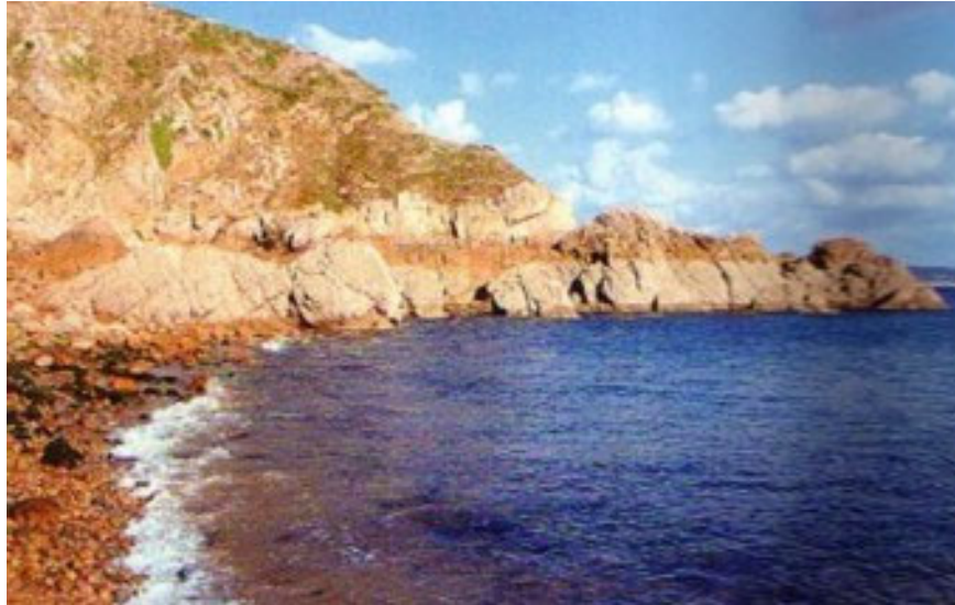
Baie de la Gravelette