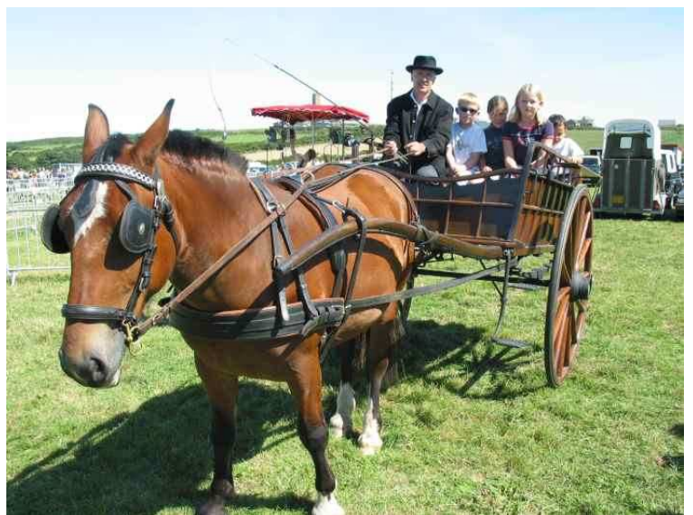
Promenade en carriole en 2004

Démonstration de fenaison des années 1920, 1970 et 1990.