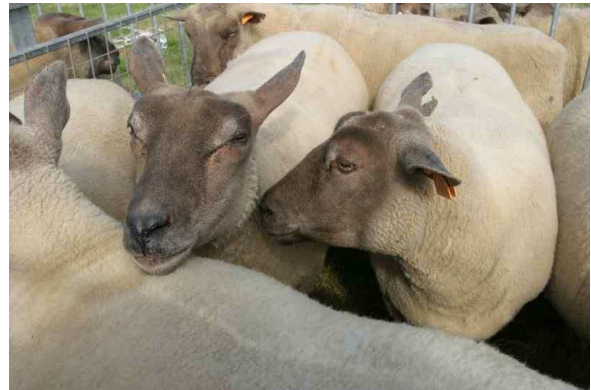
Foire aux moutons 2005 et 2006

Le matin, Traditionnelle foire aux moutons et aux chèvres : environ 400 moutons et quelques chèvres et ânes.