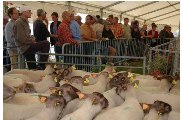
Vente UPRA en 2005, la veille de la foire