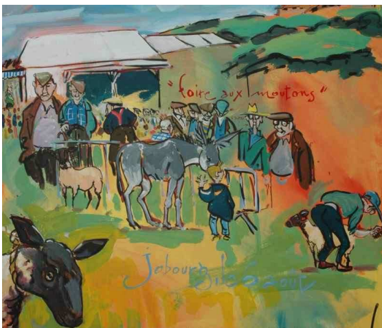
Acrylique réalisé en 2005 par Patou Deballon pendant la foire