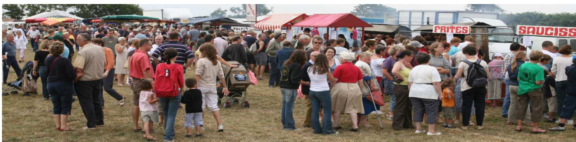
Devant les rôtisseurs en 2006