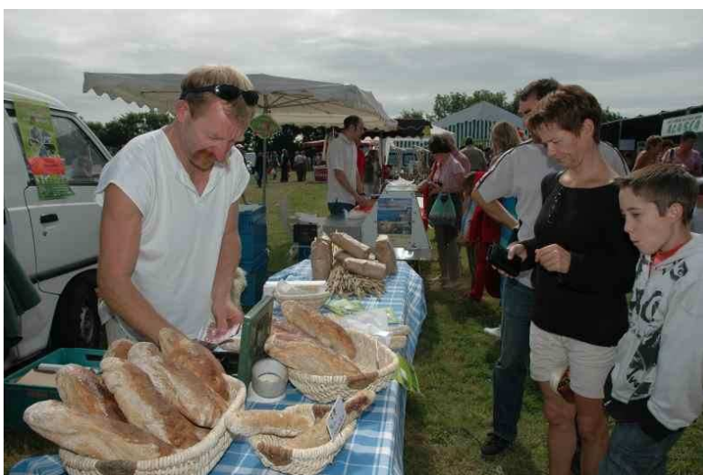
Marché du terroir en 2005