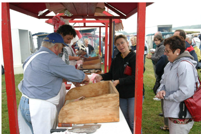
Rôtisseurs en 2007