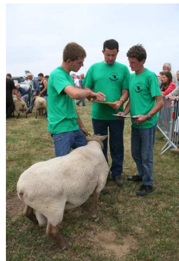
Anes- pesée du mouton – Foire aux moutons 2006

Pesée du mouton : un mouton à gagner en évaluant le poids d'un mouton à l'œil . Les gagnants emportent des morceaux de mouton du gigot jusqu'au collier ( à déguster bien sur).