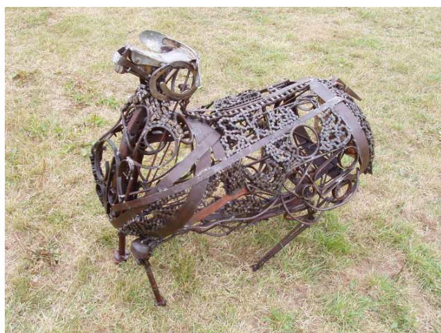
Sculpture de mouton réalisé en 2006 par la compagnie Yakasoudé