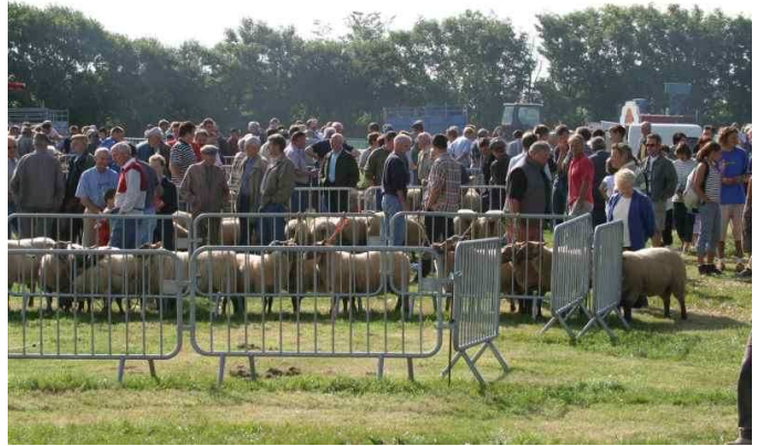
foire aux moutons 2005

Une foire aux moutons sur la commune de Jobourg, créée en 1937 par le conseil municipal de l'époque et qui accueille maintenant tous les ans 400 moutons et plus de 4000 personnes.