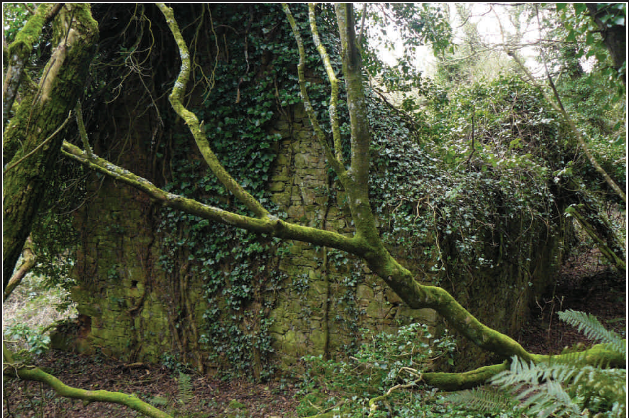
Sous-le-cotil : Ruines d'une maison.

Sous-le-cotil était un hameau d'une dizaine de maisons. Il s'étalait sur le flanc sud d'une colline, bien à l'abri des vents de nord. Pour s'y rendre, il fallait emprunter le chemin reliant Calais à La Vallée sur Herqueville. Sous-le-cotil était encore habité en 1913 comme l'atteste une monographie communale rédigée cette année-là par J.Anquetil, instituteur. Aujourd'hui il ne reste plus que des belles ruines envahies par le lierre, le houx et les ronces.