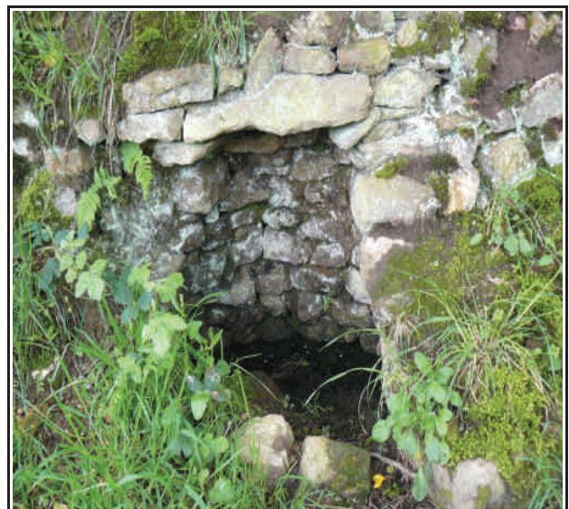
Fontaine à La Castellerie

La ferme de La Haye se situait à quelques dizaines de mètres à l'ouest de la Boissellerie. D'ailleurs les personnes habitants la Boissellerie sont comptabilisées dans le recensement de 1831 avec celles de La Haye. En 1913, J.Anquetil indiquait déjà que La Haye avait disparu. Il nous apprend également que La Haye appartenait aux sieurs Lucas seigneurs de la Haye.