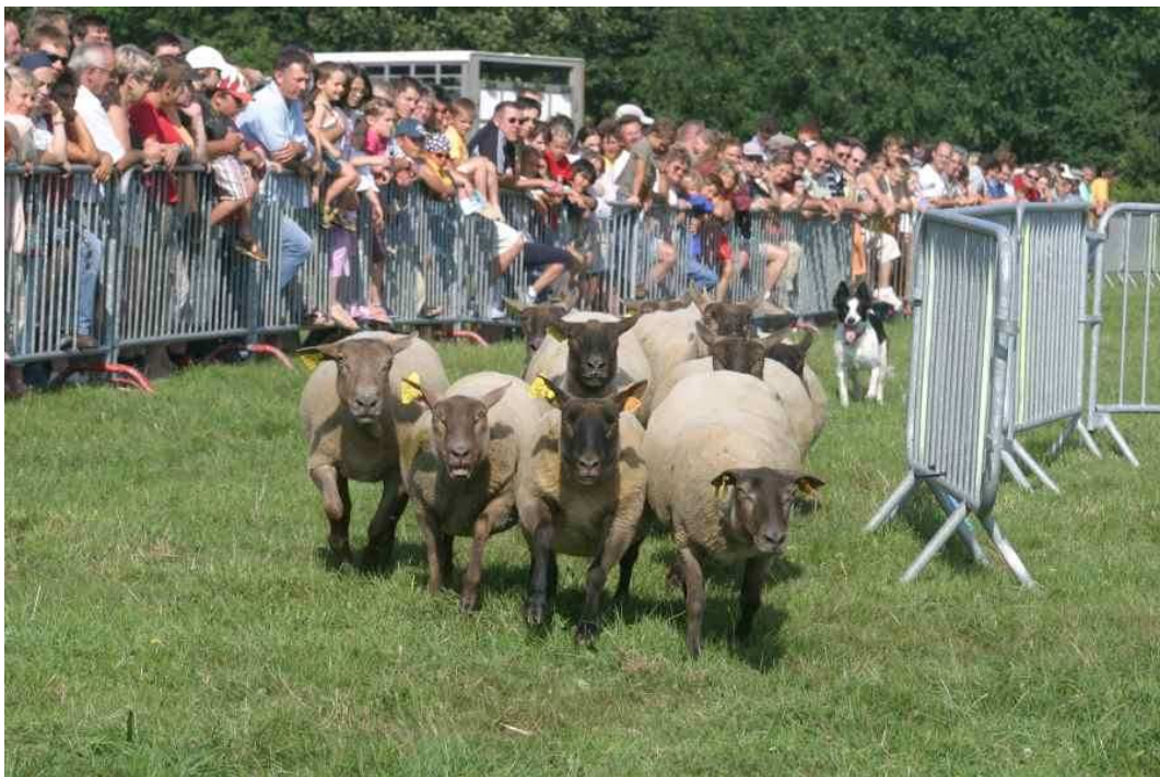
Démonstration de chiens de troupeau en 2004

Son histoire commence avec des moutons que l'on appelle des moutons de pays. Ces moutons étaient rustiques et résistants mais peu rentables : ils donnaient aux paysans marins un peu de lait, un peu de laine et un peu de viande. Au début du XX ème siècle, des éleveurs s'intéressent à ces bêtes et décidèrent de développer leur qualité bouchère en leur injectant du sang anglais grâce à des croisements avec des béliers Dishley et Southdown. La race prend du poids et de la puissance. Au début des années 60, des paysans farouchement attachés à cette race locale (donc rare) la croise à nouveau avec des béliers Suffolk, mais aussi avec des béliers Avranchin qui donnent déjà satisfaction. Et c'est ainsi que la race est reconnue officiellement par le ministère de l'agriculture en 1982. Le Roussin est une race bouchère et d'herbage, elle est rustique, précoce et prolifique.