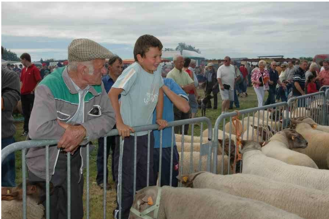
Foire au mouton 2005

D'un gabarit épais et tassé, le Roussin possède une ossature fine qui lui permet de fournir une carcasse sans gras, d'un excellent rendement, d'une viande caractérisée par la finesse de ses fibres et d'une saveur très appréciée des bouchers.