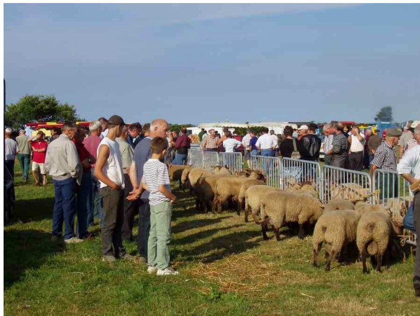
foire aux moutons 2004

Fait et délibéré à Jobourg, les jours mois et an susdits. »