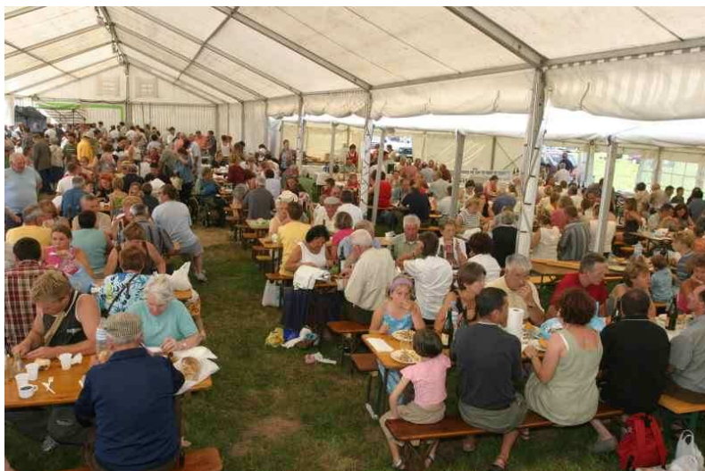
Repas sous la tente en 2004

Une vente matinale de roussins de la Hague ( petite race de moutons rustiques originaires du pays de la Hague ).