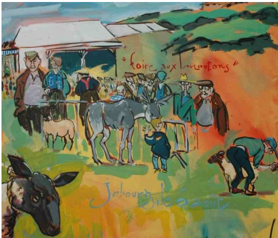
Acrylique réalisé en 2005 par Patou Deballon pendant la foire