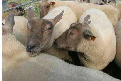
Foire aux moutons 2005 et 2006

Le matin, Traditionnelle foire aux moutons et aux chèvres : environ 300 moutons et quelques chèvres et ânes.