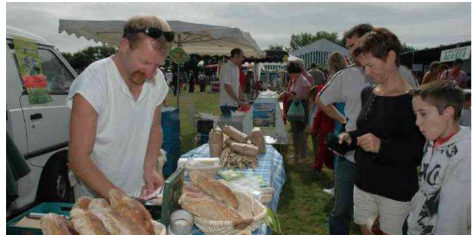
Marché du terroir en 2005

Les écrivains locaux viennent aussi présenter leurs livres.