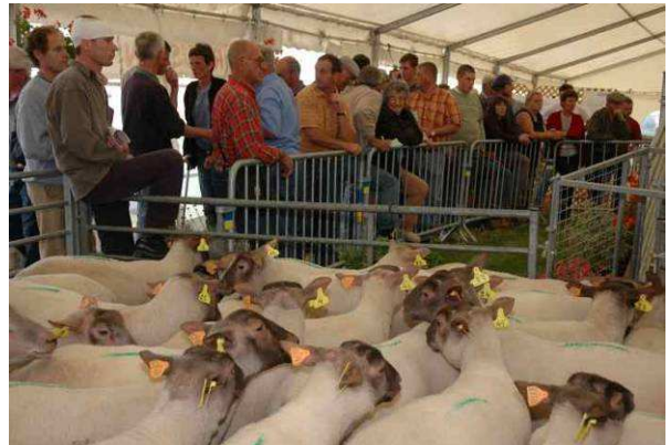
Vente UPRA en 2005, la veille de la foire