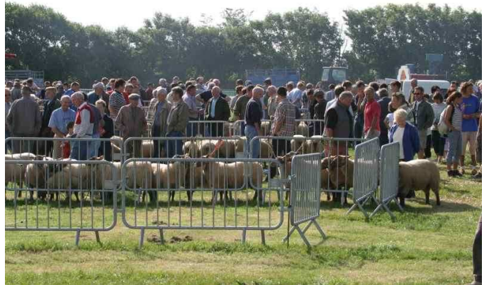
foire aux moutons 2005

Une foire aux moutons sur la commune de Jobourg, créée en 1937 par le conseil municipal de l'époque et qui accueille maintenant tous les ans 400 moutons et près de 7000 personnes.