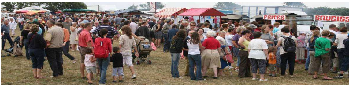
Devant les rôtisseurs en 2006