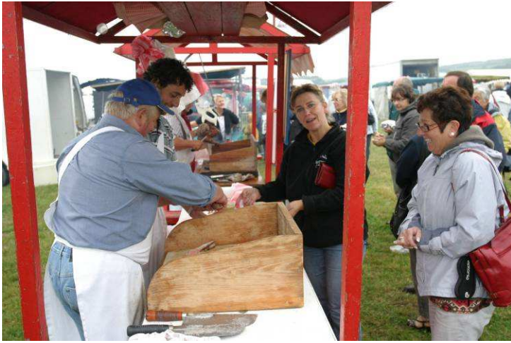
Rôtisseurs en 2007