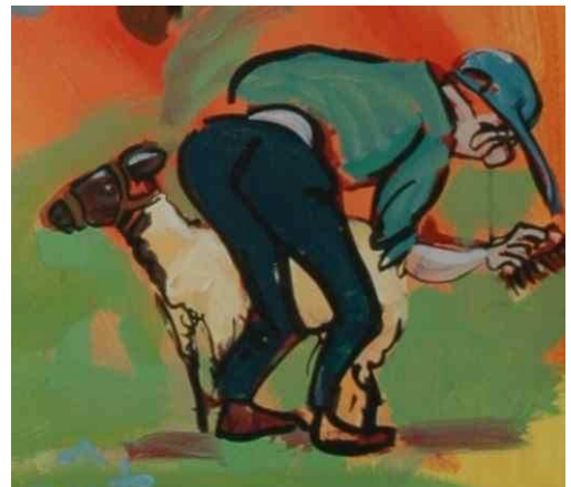
Détail acrylique réalisé en 2005 par Patou Deballon

Un immense repas sous la tente avec la population locale et estivale avec l'agneau dégusté grillé au feu de bois (grande tradition du Cotentin).