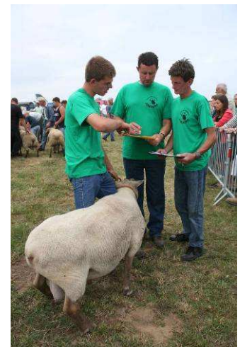
Anes- pesée du mouton – Foire aux moutons 2006

Pesée du mouton : un mouton à gagner en évaluant le poids d'un mouton à l'œil . Les gagnants emportent des morceaux de mouton du gigot jusqu'au collier ( à déguster bien sur).